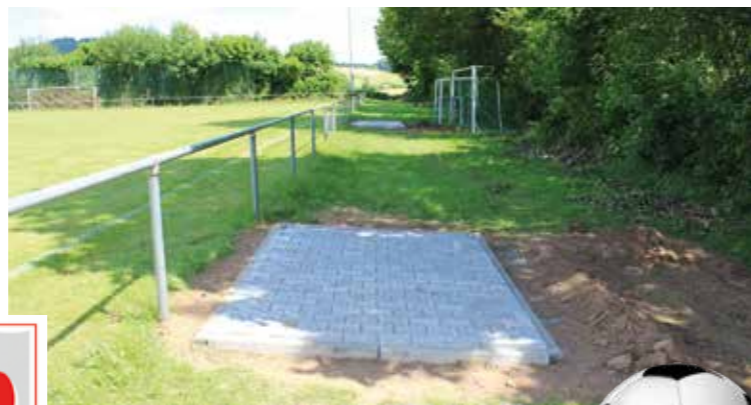
Auch für die Spielerüberdachung sind die Fundamente gelegt!